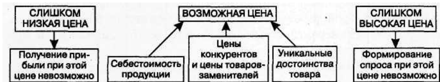
Рис. 5. Основные соображения при назначении цены

5. Выбор метода ценообразования. Зная график спроса, расчетную сумму издержек и цены конкурентов, фирма готова к выбору цены собственного товара. Цена эта будет где-то в промежутке между слишком низкой, не обеспечивающей прибыли, и слишком высокой, препятствующей формированию спроса. На рисунке 5 в обобщенном виде представлены три основных соображения, которыми руководствуются при назначении цены. Минимально возможная цена определяется себестоимостью продукции, максимальная — наличием каких-то уникальных достоинств в товаре фирмы. Цены товаров конкурентов и товаров-заменителей дают средний уровень, которого фирме и следует придерживаться при назначении цены.