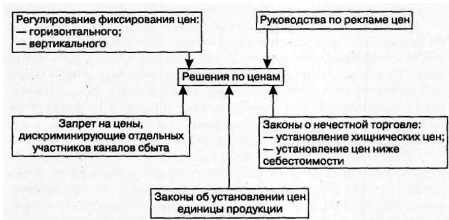
Рис. 2. Воздействие правительства на принятие решений по ценам

2. ПРАВИТЕЛЬСТВО. Правительственные меры, связанные с ценообразованием, могут быть подразделены на пять основных групп, показанных на рис. 2.