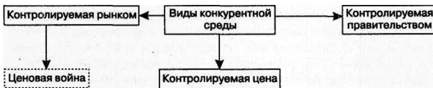
Рис. 3. Ценообразование в конкурентной среде

4. КОНКУРЕНЦИЯ. Еще одним фактором, определяющим степень контроля фирмы над ценами, является та конкурентная среда, в которой она функционирует (рис. 3).