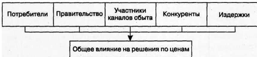
Рис. 1. Факторы, влияющие на установление цен

Эта формула показывает процентное изменение в величине спроса на каждый процент изменения в цене. В силу того что спрос обычно уменьшается по мере роста цен, эластичность измеряется отрицательными величинами. Однако для упрощения расчеты эластичности в этом разделе выражаются в положительных числах.